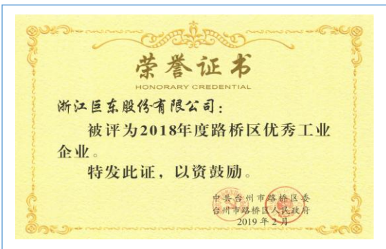
2019 年 2 月本公司被评为 2018 年度路桥区优秀工业企业