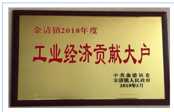
2019 年 3 月本公司被评为金清镇 2018 年度工业经济贡献大户