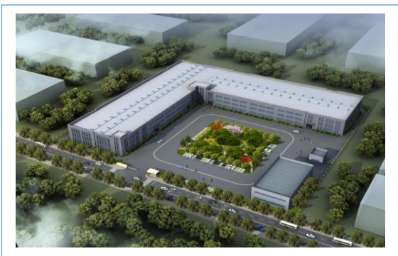
2019 年 1 月本公司全资子公司台州巨东精密铸造有限公司正式投产