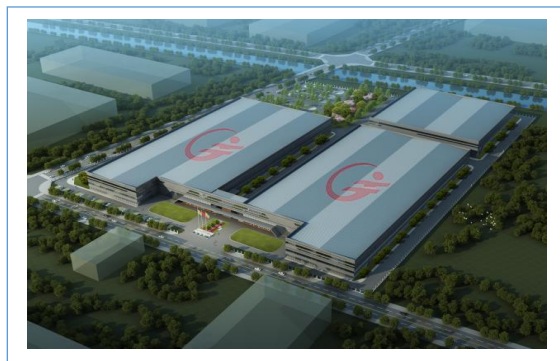
2019 年 4 月本公司全资子公司台州巨东科技有限公司取得施工许可证