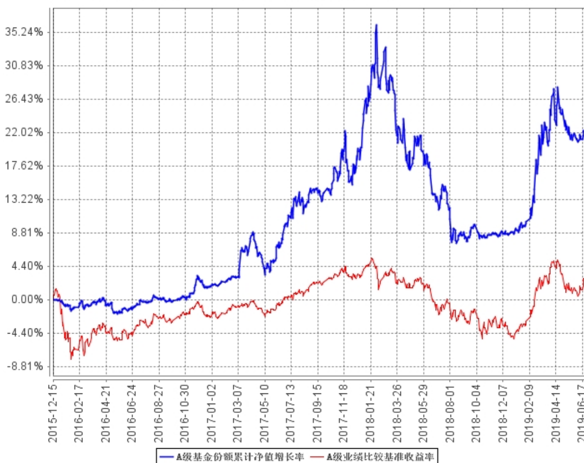
A级基金份额累计净值增长率与同期业绩比较基准收益率的历史走势对比图