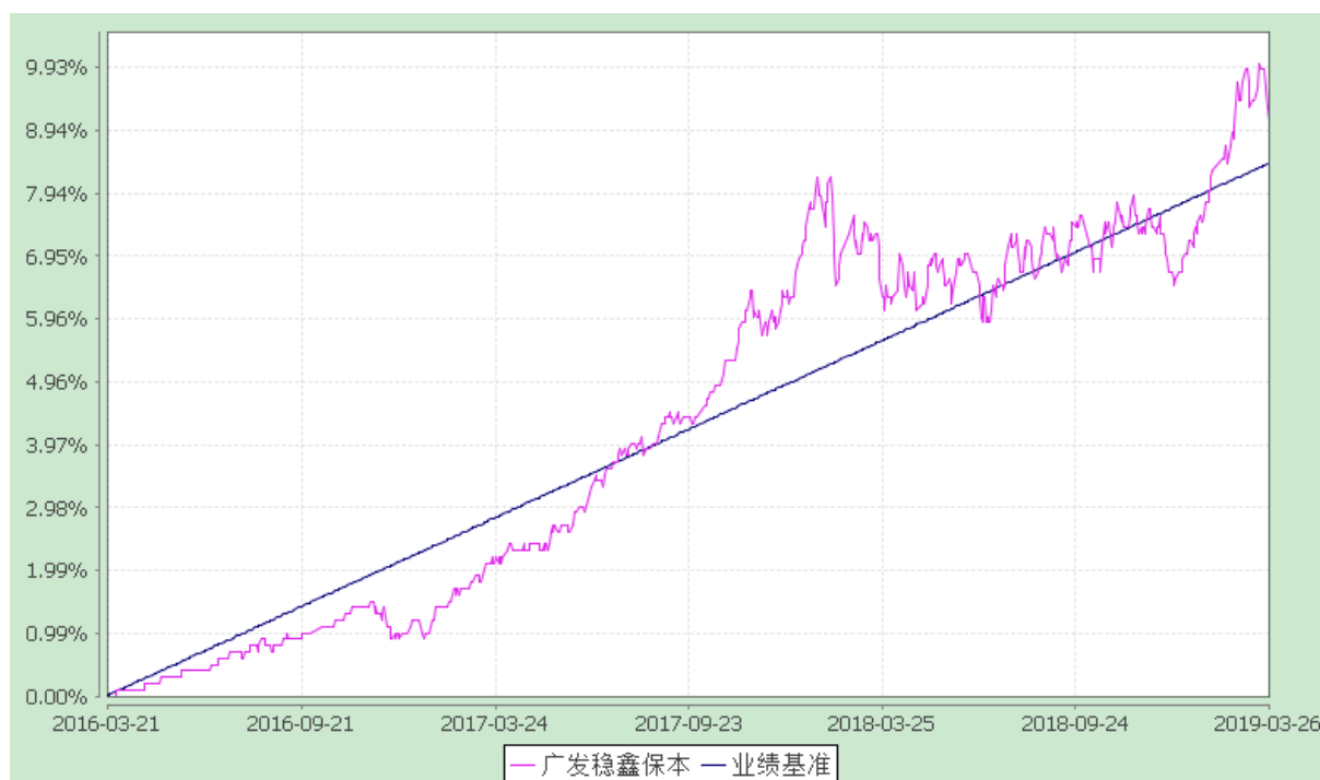
广发稳鑫保本混合型证券投资基金 份额累计净值增长率与业绩比较基准收益率历史走势对比图 (2016 年 3 月 21 日至 2019 年 3 月 26 日)