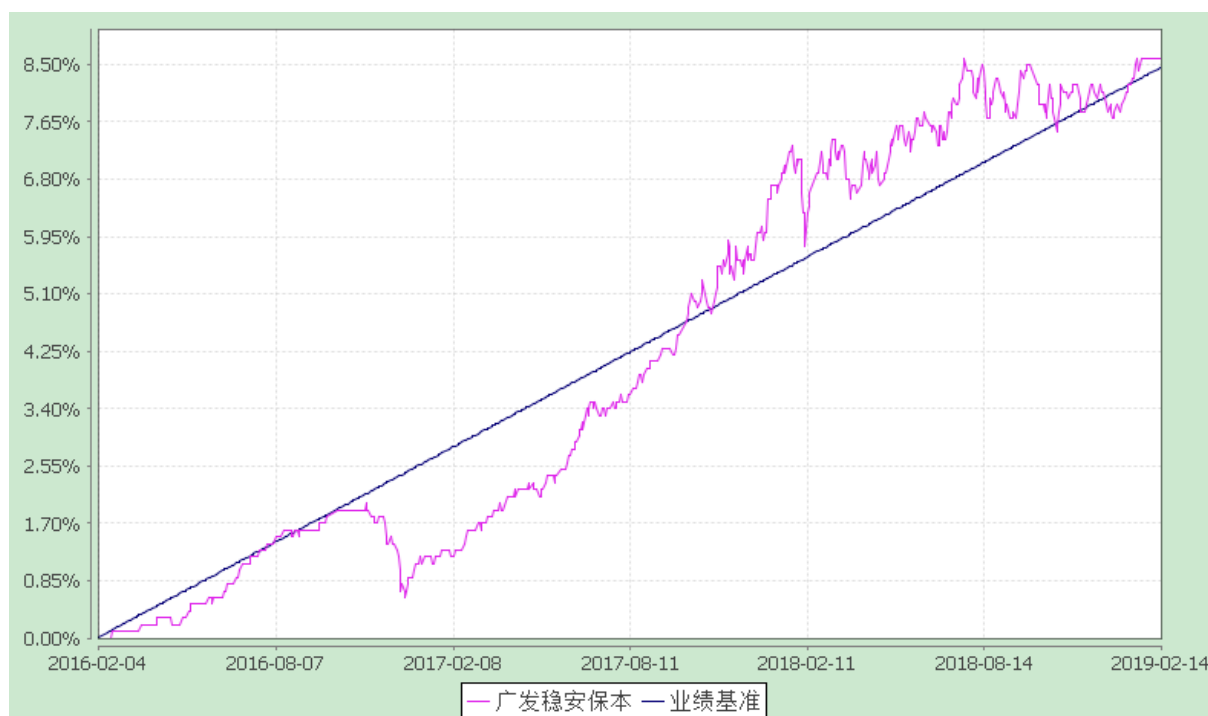
广发稳安保本混合型证券投资基金 份额累计净值增长率与业绩比较基准收益率历史走势对比图 （2016 年 2 月 4 日至 2019 年 2 月 14 日）