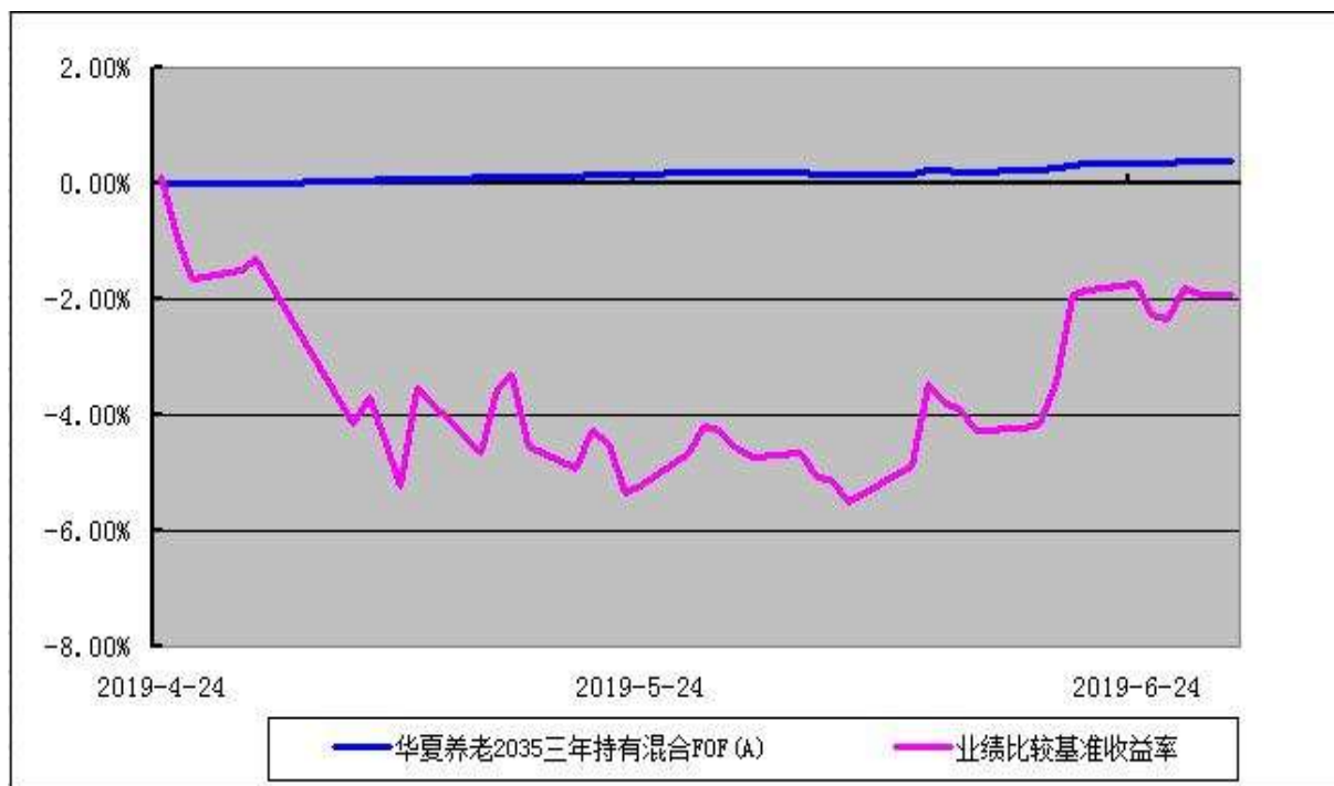
华夏养老 2035 三年持有混合（FOF）C