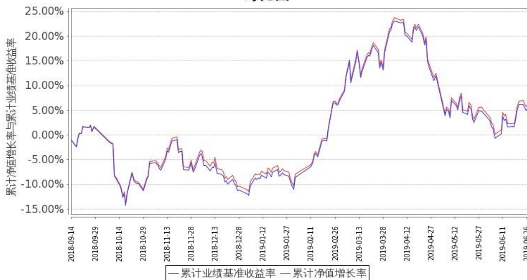
图 2：嘉实中证 500ETF 联接 C 份额累计净值增长率与同期业绩比较基准收益率的历史走势对比图 (2018 年 9 月 14 日至 2019 年 6 月 30 日)

注：按基金合同和招募说明书的约定，本基金自基金合同生效日起 3 个月内为建仓期，建仓期结束时本基金的各项投资比例符合基金合同“第十二部分（二）投资范围和（七）投资限制”的有关约定。