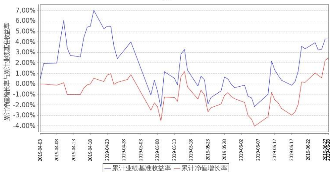
图 1：嘉实消费精选股票 A 基金累计份额净值增长率与同期业绩比较基准收益率的历史走势对比图