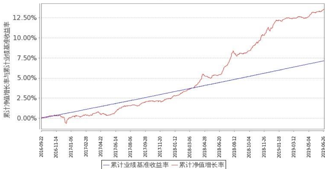
图 2: 嘉实稳祥纯债债券 C 基金份额累计净值增长率与同期业绩比较基准收益率的历史走势对比图