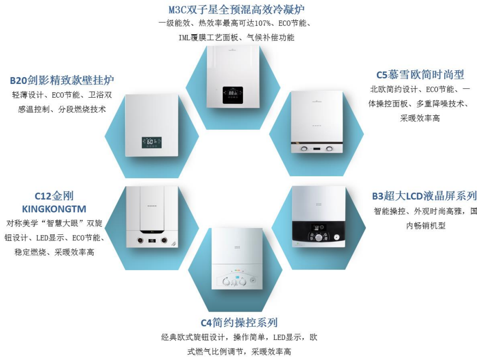
图 8：小松鼠壁挂炉部分新产品

公司旗下的“小松鼠”“劳力特”两大品牌覆盖采暖、新风、净水及多能源集成系统等产品领域，为用户提供健康、舒适、生态、节能的家居环境全系统解决方案，致力于成为智能舒适家居领域的国产典范。