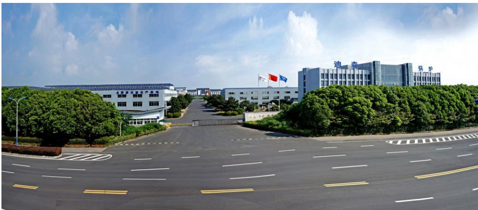
图 4：迪森（常州）锅炉制造基地

报告期内，公司可转债项目“年产 20,000 蒸吨清洁能源锅炉改扩建项目”正在稳步推进。子公司迪森设备已整体搬迁及转移至常州锅炉，公司正在积极推进后续业务整合、资质过渡、员工安置等相关工作，以尽快达成水管锅炉、火管锅炉、常压锅炉、导热油炉等产能扩张，提升公司装备制造能力及核心竞争力，并将常州锅炉打造成公司清洁能源应用装备的研发制造基地。