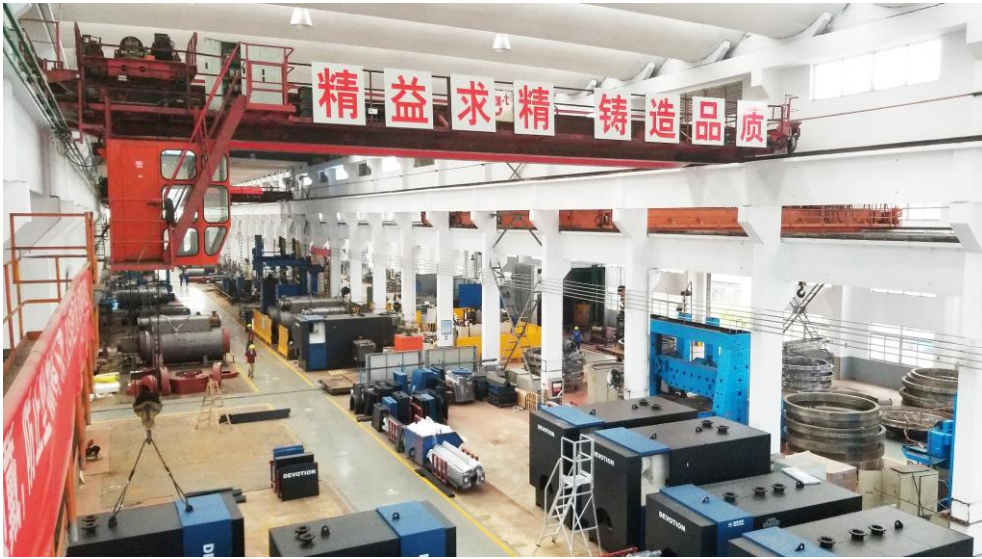
图 3：清洁能源应用装备制造

报告期内，公司可转债项目“年产 20,000 蒸吨清洁能源锅炉改扩建项目”正在稳步推进。子公司迪森设备已整体搬迁及转移至常州锅炉，公司正在积极推进后续业务整合、资质过渡、员工安置等相关工作，以尽快达成水管锅炉、火管锅炉、常压锅炉、导热油炉等产能扩张，提升公司装备制造能力及核心竞争力，并将常州锅炉打造成公司清洁能源应用装备的研发制造基地。