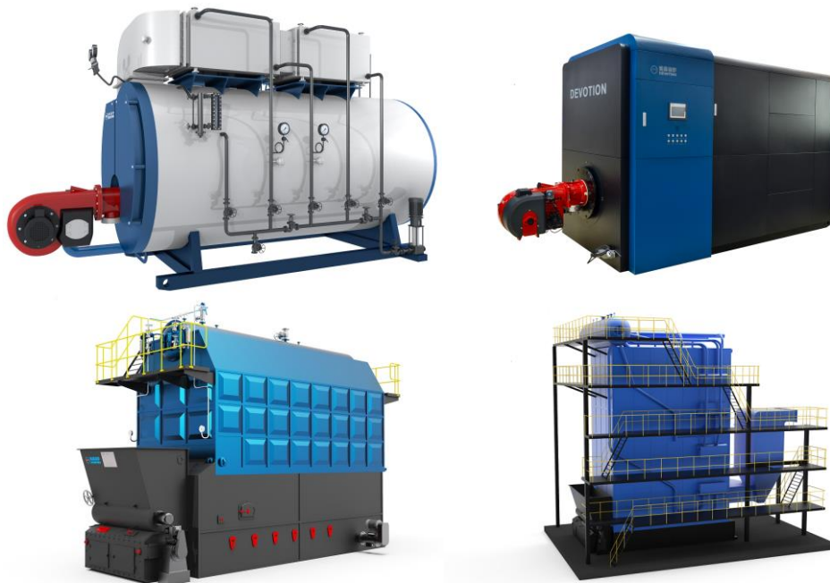
图 7：迪森锅炉部分型号产品

公司拥有国家特种设备制造许可证 A 级锅炉制造许可证资质，A2 级（三类压力容器）压力容器设计许可证和制造许可证，美国 ASME 锅炉和压力容器设计制造许可证(S 和 U 钢印)。迪森（常州）锅炉是中国建材机械领军企业、中国建材蒸压釜领军企业、中国唯一的蒸压釜安全技术培训基地。产品覆盖气、油、电、生物质燃料等，种类齐全，能满足不同用户的各种热能需求，是行业领先的燃气锅炉制造商，“迪森”牌燃气锅炉是行业内知名品牌。此外，公司自主研发的低氮冷凝系列燃气锅炉，被认定为广东省高新技术产品。迪森积极研发的新一代冷凝式锅炉，并采用下置波形炉胆和较大的“湿背”回燃室、三回程湿背锅壳设计，NO x 排放量低至 30mg/m 3 以下，热效率可高达 103% 以上，完全符合现行环保政策低氮燃烧及排放要求。