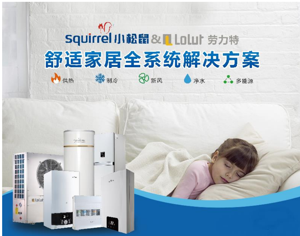
图 6：智能舒适家居产品系列

报告期内，迪森家居基于工业物联网技术，创新融合智能舒适家居产品生态体系，结合大数据和人工智能技术，通过自动采集室内环境中的温度、湿度、新风量、洁净度、水温、水质软硬度等数据，实时反馈数据信息，实现远程控制。并可通过收集、分析用户行为数据、室内环境等自我学习，提供个性化舒适度解决方案，实现智能科技与品质生活的完美结合，为用户打造安全便捷、舒适健康、节能环保的人性化家居环境。