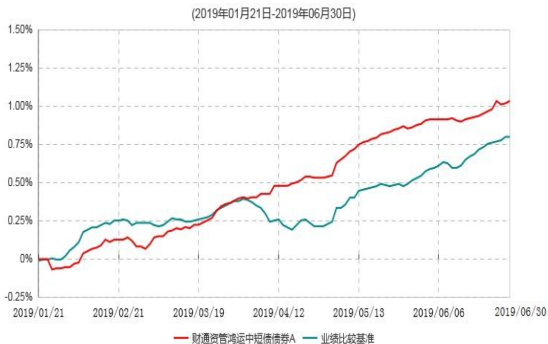
财通资管鸿运中短债债券A累计净值增长率与业绩比较基准收益率历史走势对比图