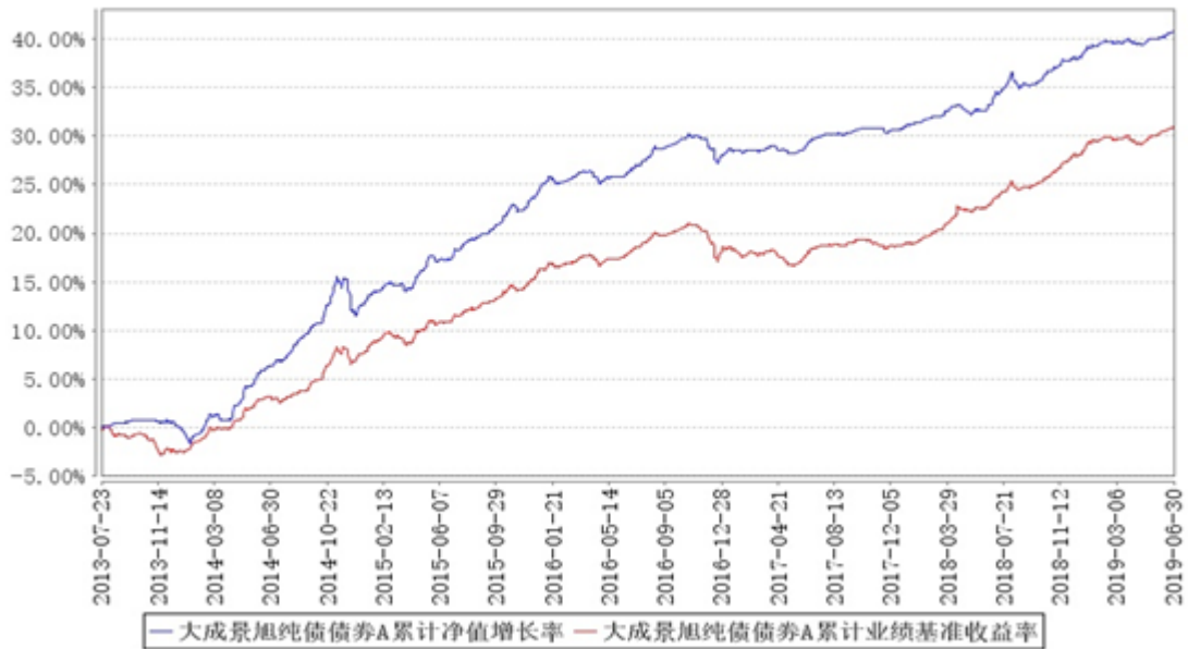
大成景旭纯债债券A累计净值增长率与同期业绩比较基准收益率的历史走势对比图

(二)自基金合同生效以来基金累计净值增长率变动及其与同期业绩比较基准收益率变动的比较