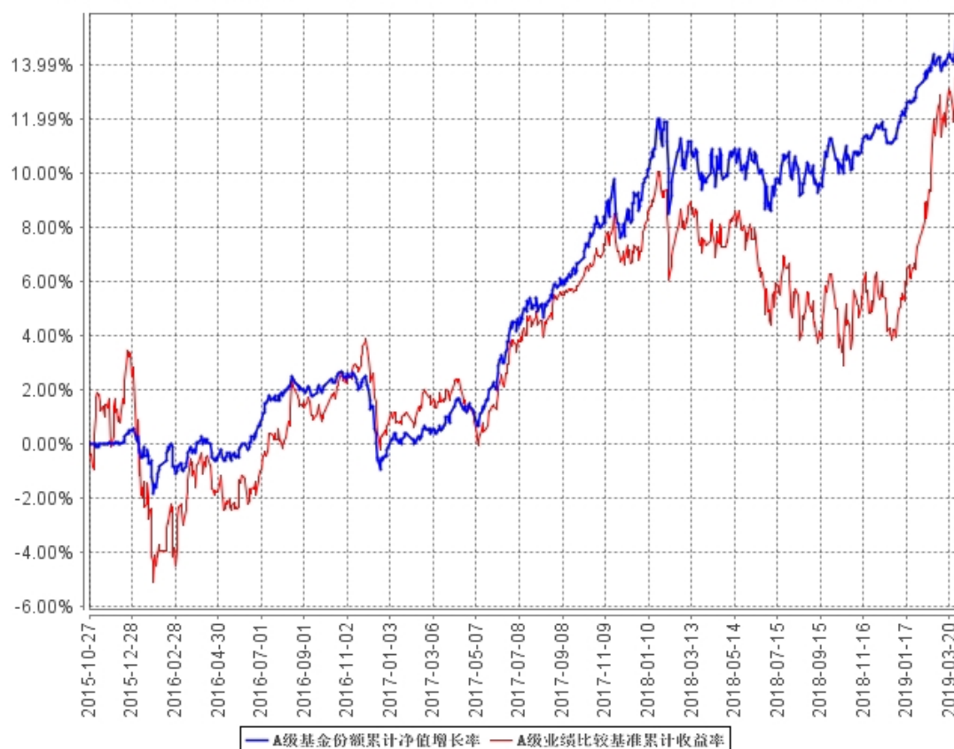
A 级基金份额累计净值增长率与同期业绩比较基准收益率的历史走势对比图