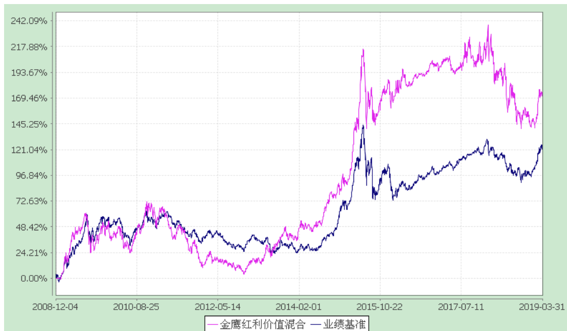
金鹰红利价值灵活配置混合型证券投资基金 累计净值增长率与业绩比较基准收益率历史走势对比图 (2008 年 12 月 4 日至 2019 年 3 月 31 日)