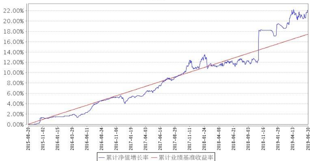
景顺长城泰和回报混合A累计净值增长率与同期业绩比较基准收益率的历史走势对比图