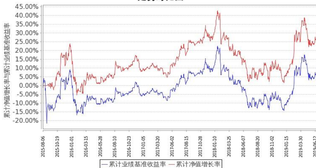
图1：嘉实中证金融地产ETF联接A基金份额累计净值增长率与同期业绩比较基准收益率的历史走势对比图 (2015年8月6日至2019年6月30日)