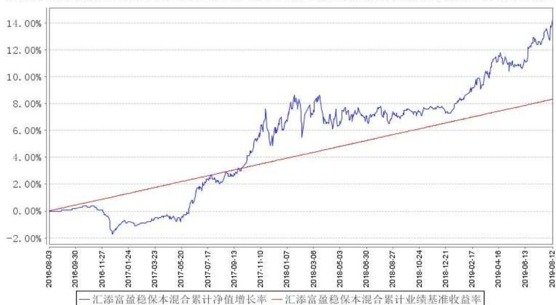
汇添富盈泰混合累计净值增长率与同期业绩比较基准收益率的历史走势对比图

注：本基金建仓期为本《基金合同》生效之日（2016年8月3日）起6个月，建仓期结束时各项资产配置比例符合合同规定。