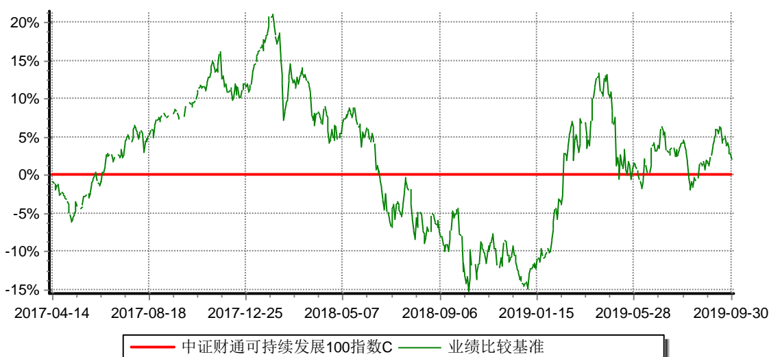
中证财通中国可持续发展100(ECPI ESG)指数增强型证券投资基金C 累计净值增长率与业绩比较基准收益率历史走势对比图 (2017年04月14日-2019年9月30日)

注：(1)本基金合同生效日为2013年3月22日；自2017年4月14日起本基金增设收取销售服务费的C类份额；报告期内未有C类份额申购数据，报告期内单位净值为1.0000元。