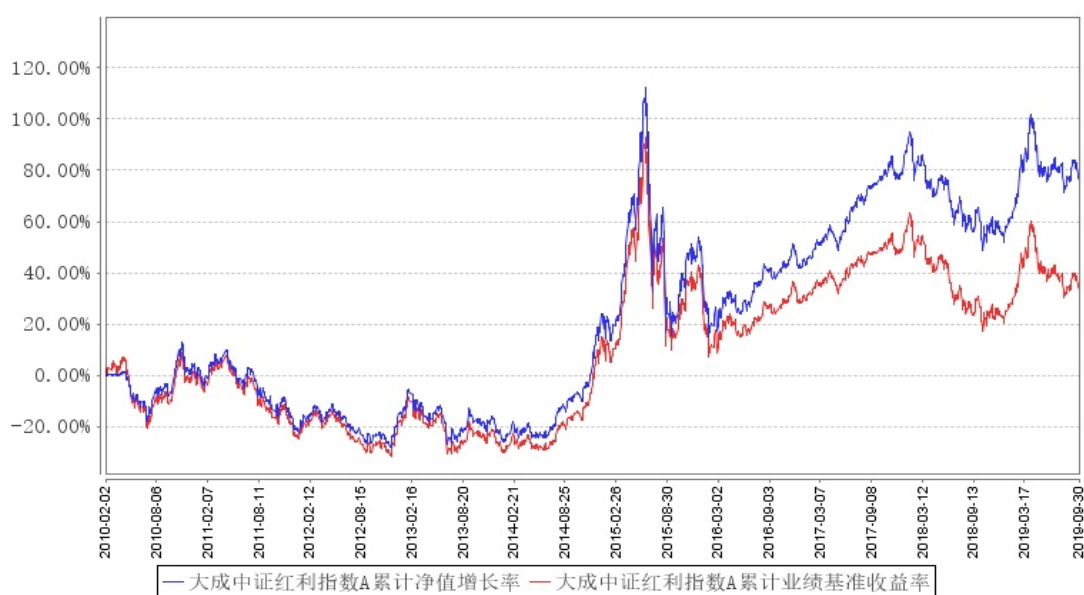
大成中证红利指数A累计净值增长率与同期业绩比较基准收益率的历史走势对比图