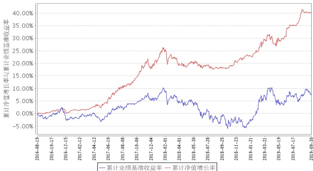
安信新价值混合A累计净值增长率与同期业绩比较基准收益率的历史走势对比图