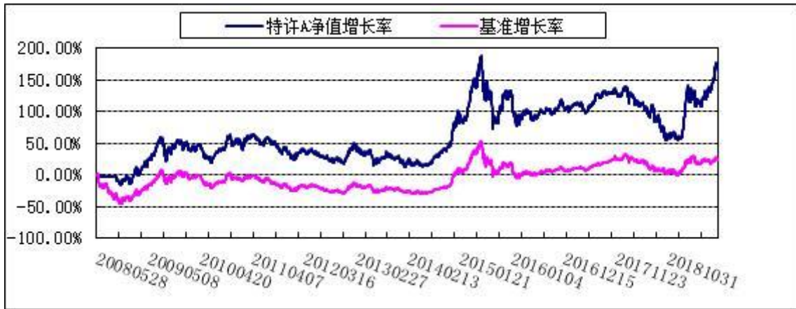
2. 博时特许价值混合R: