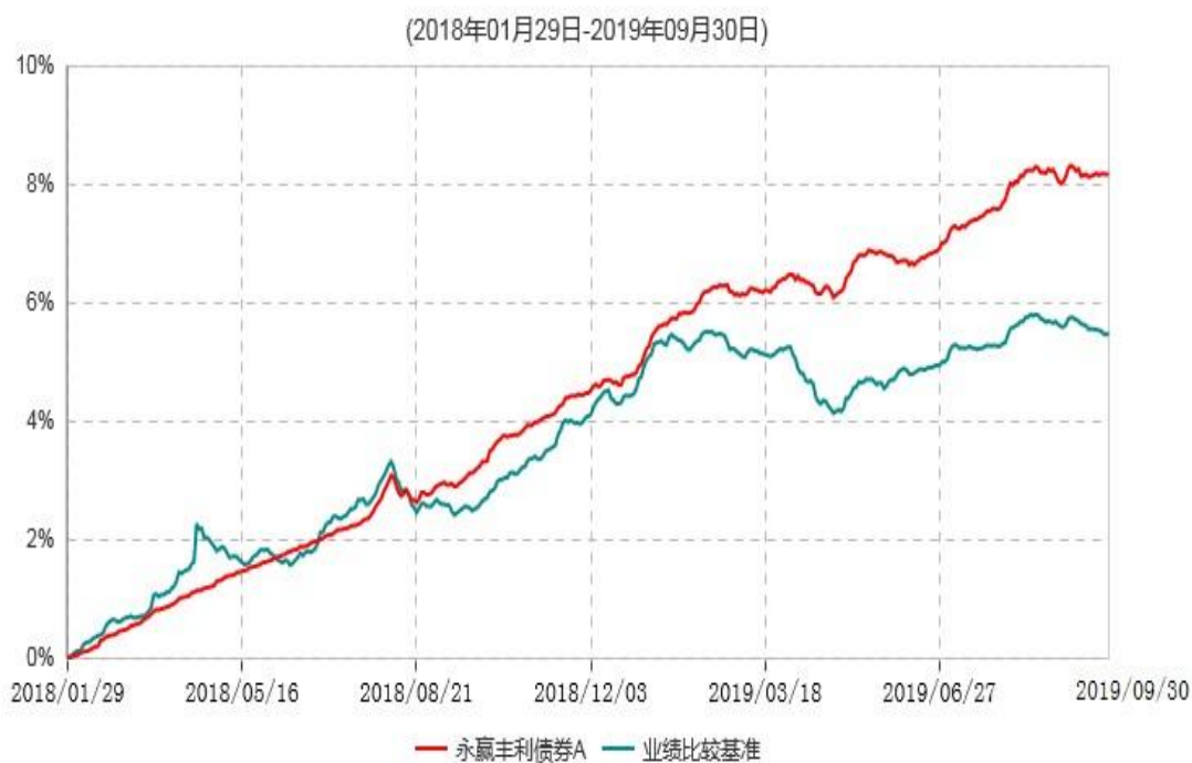
永赢丰利债券A累计净值增长率与业绩比较基准收益率历史走势对比图