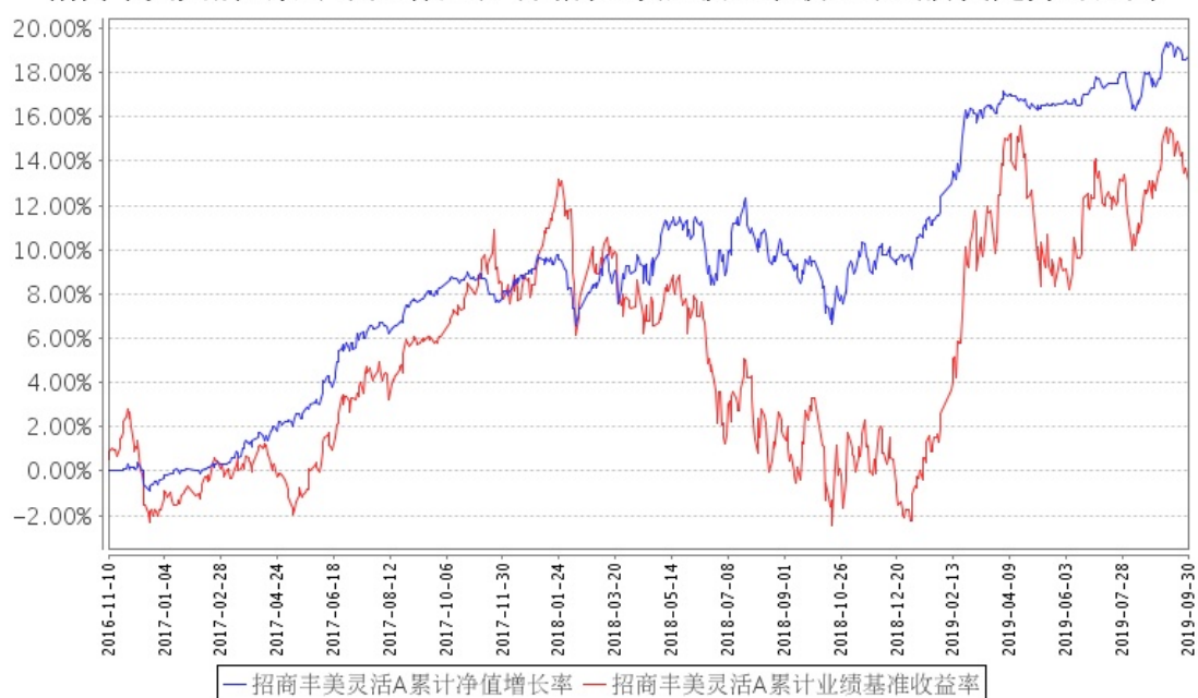
招商丰美灵活A累计净值增长率与同期业绩比较基准收益率的历史走势对比图