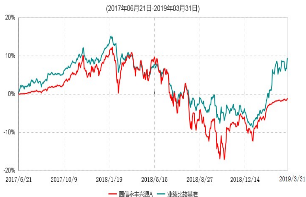
圆信永丰兴源A累计净值增长率与业绩比较基准收益率历史走势对比图