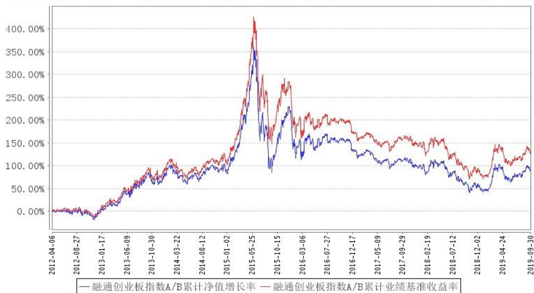
融通创业板指数A/B累计净值增长率与同期业绩比较基准收益率的历史走势对比图