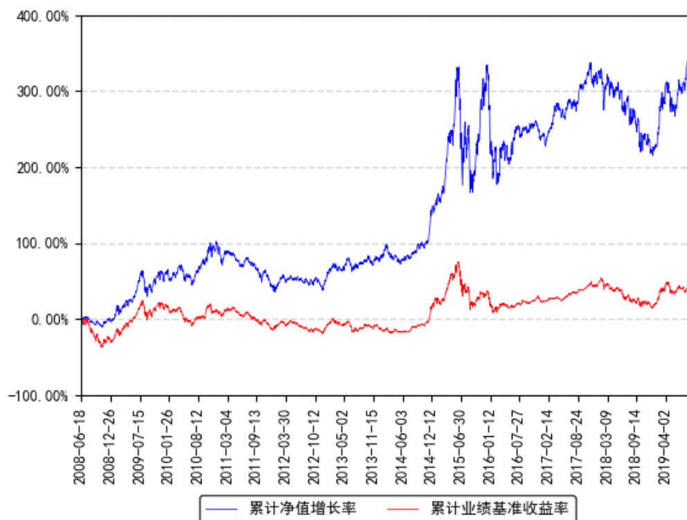
南方优选价值混合A累计净值增长率与同期业绩比较基准收益率的历史走势对比图