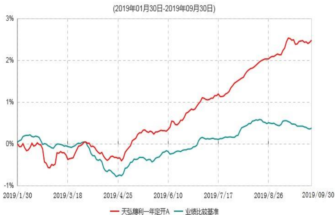
天弘穗利一年定开A累计净值增长率与业绩比较基准收益率历史走势对比图