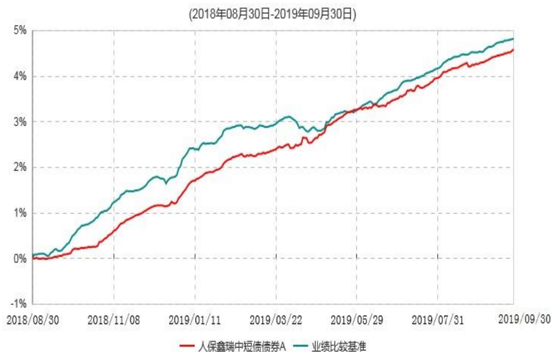
人保鑫瑞中短债债券A累计净值增长率与业绩比较基准收益率历史走势对比图