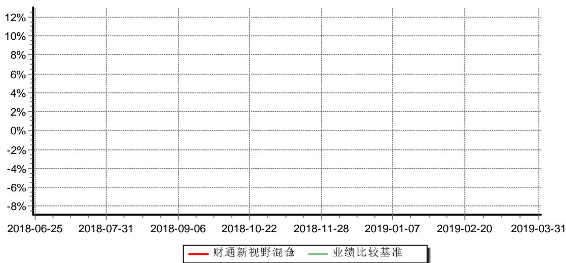
财通新视野灵活配置混合型证券投资基金C 累计净值增长率与业绩比较基准收益率历史走势对比图 （2018年06月25日-2019年3月31日）