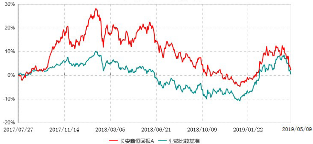
长安鑫恒回报A累计净值增长率与业绩比较基准收益率历史走势对比图 (2017年07月27日-2019年05月09日)

自基金合同生效之日起6个月内基金各项资产配置比例需符合基金合同要求。建仓期结束后，各项资产配置比例已符合基金合同有关投资比例的约定。本基金从2019年5月10日转型为长安泓源纯债债券型证券投资基金,上图报告期间的结束日为2019年5月9日。