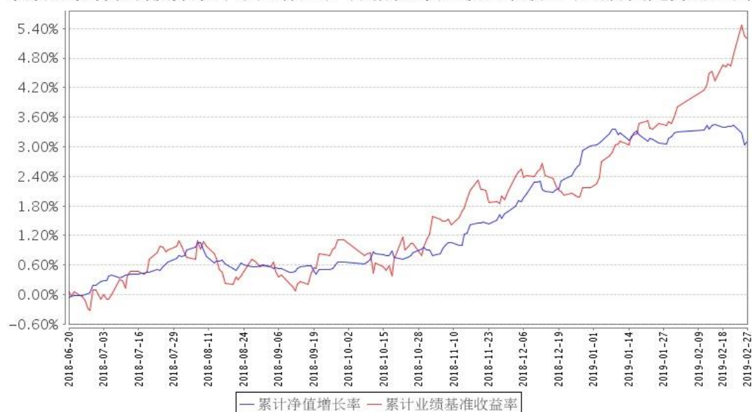
景顺长景瑞双利债券累计净值增长率与同期业绩比较基准收益率的历史走势对比图

注:因景顺长城景瑞双利定期开放债券型证券投资基金(以下简称“景瑞双利定期开放债券基金”)触发基金合同约定的转型条款,该基金自2018年6月20日转型为景顺长城景瑞双利债券型证券投资基金(以下简称“景瑞双利债券基金”)。