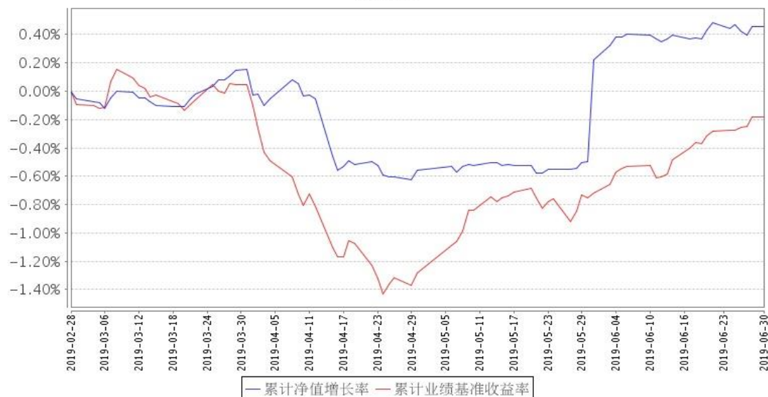
景顺长城政策性金融债债券型证券投资基金累计净值增长率与同期业绩比较基准收益率的历史走势对比图

注：2019 年 2 月 28 日，景顺长城景瑞双利债券型证券投资基金转型为景顺长城政策性金融债