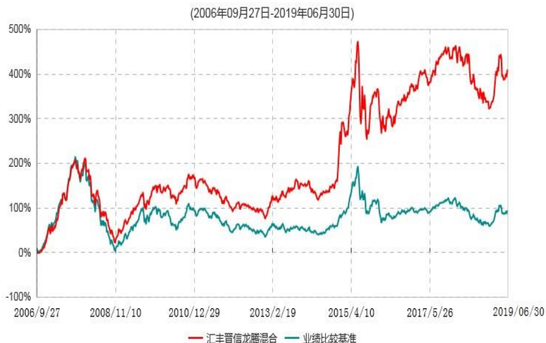
汇丰晋信龙腾混合型证券投资基金累计净值增长率与业绩比较基准收益率历史走势对比图

注：1.按照基金合同的约定，本基金的投资组合比例为：股票占基金资产的60%-95%；除股票以外的其他资产占基金资产的5%-40%，其中现金或到期日在一年期以内的国债的比例合计不低于基金资产净值的5%。本基金自基金合同生效日起不超过6个月内完成建仓。截止2007年3月27日，本基金的各项投资比例已达到基金合同约定的比例。