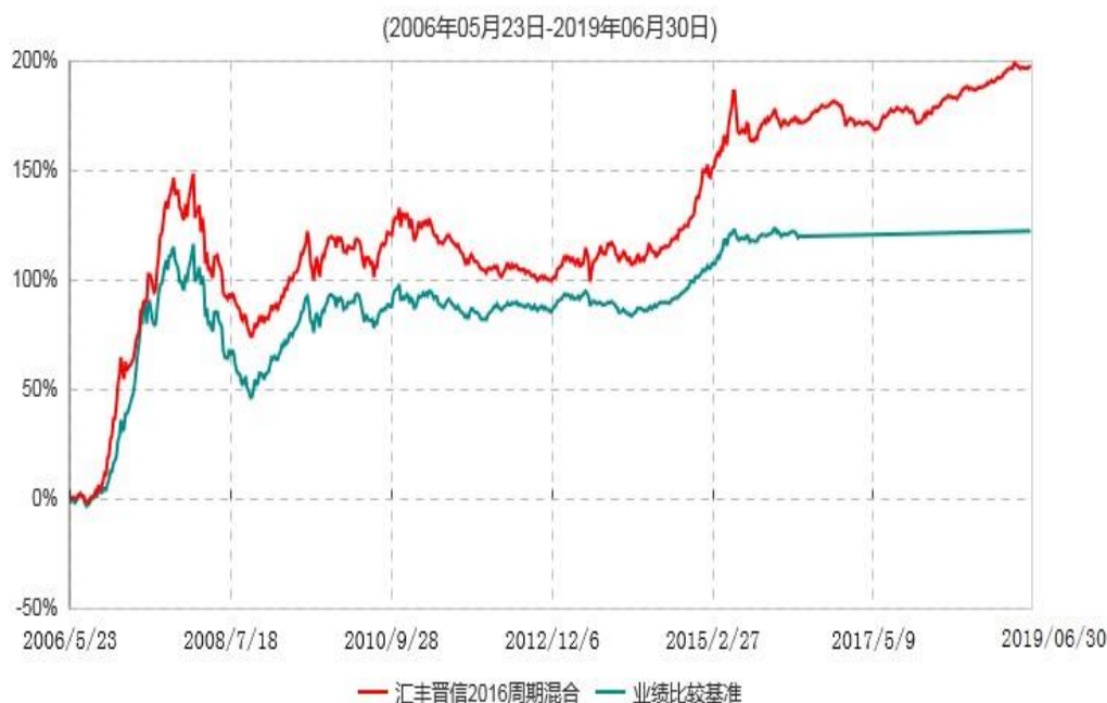
汇丰晋信2016生命周期开放式证券投资基金累计净值增长率与业绩比较基准收益率历史走势对比图