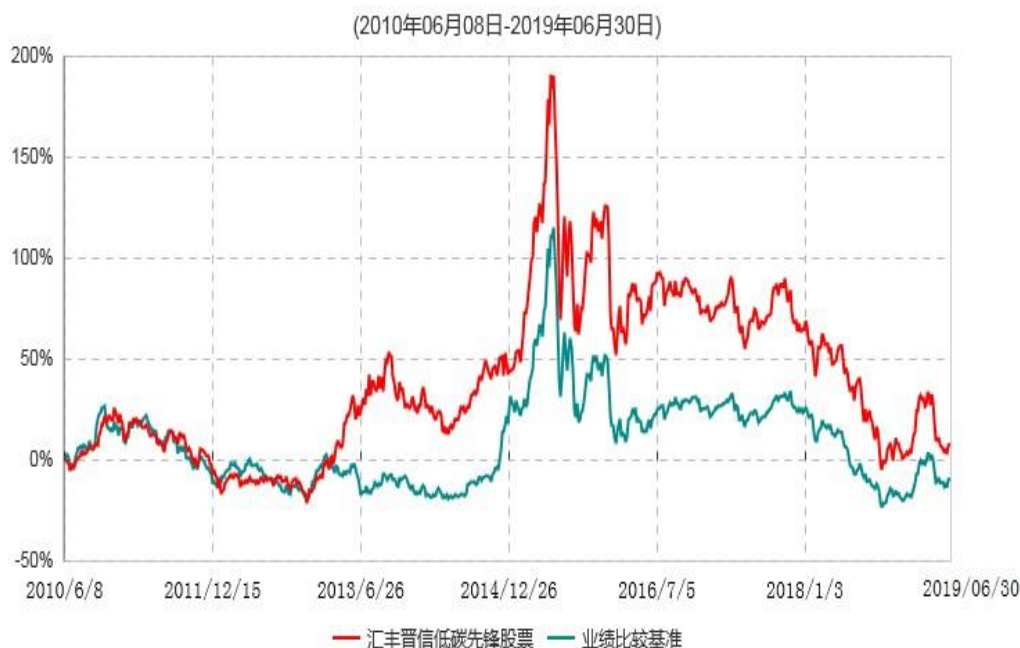
汇丰晋信低碳先锋股票型证券投资基金累计净值增长率与业绩比较基准收益率历史走势对比图