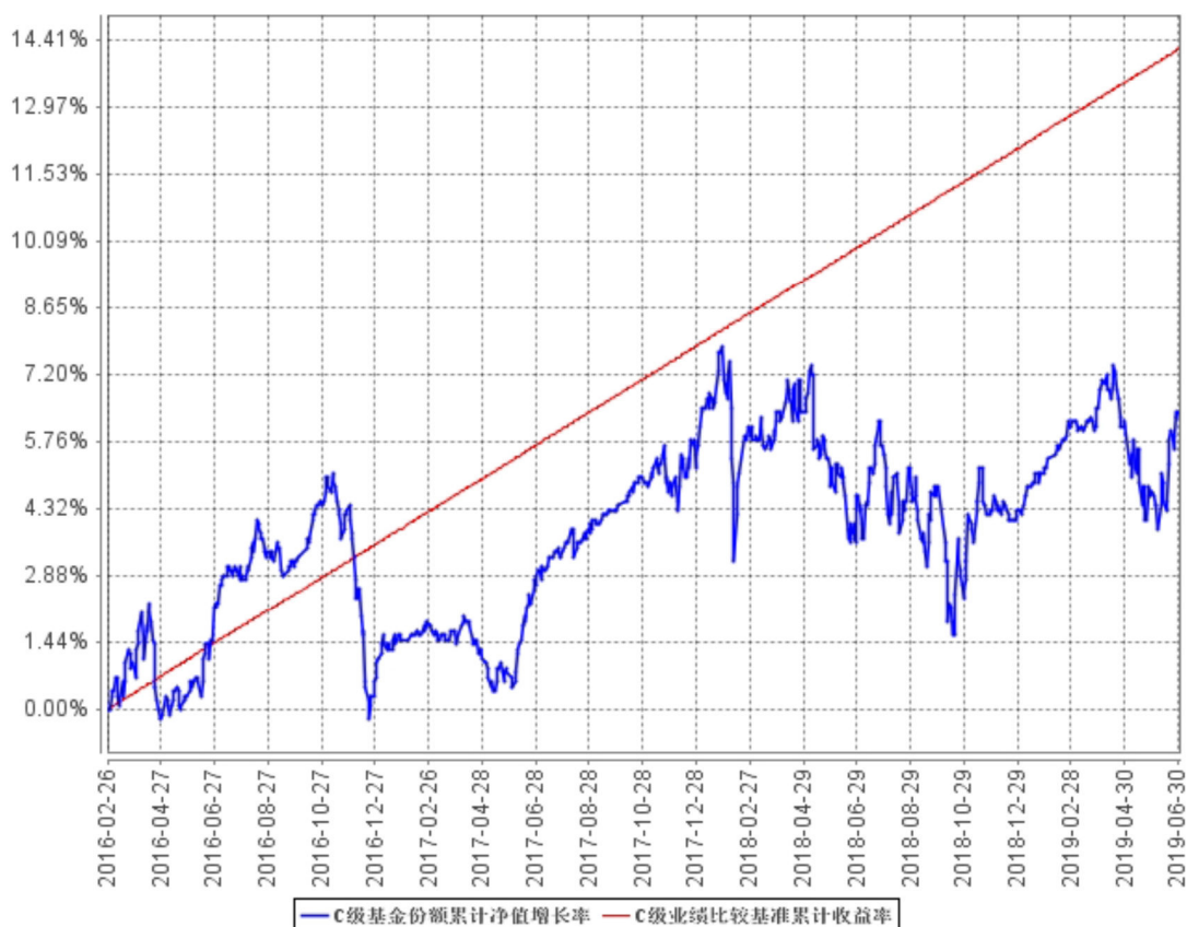
C级基金份额累计净值增长率与同期业绩比较基准收益率的历史走势对比图