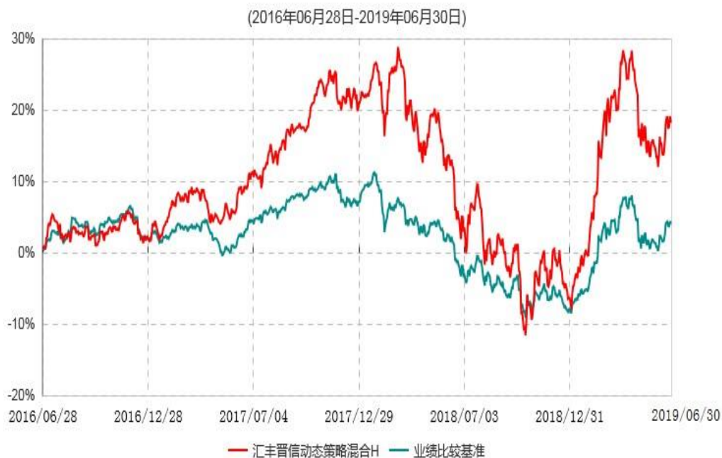
汇丰晋信动态策略混合H累计净值增长率与业绩比较基准收益率历史走势对比图

注：1. 按照基金合同的约定，本基金的投资组合比例为：股票占基金资产的30%–95%；除股票以外的其他资产占基金资产的5%–70%，其中现金（不包括结算备付金、存出保证金、应收申购款等）或到期日在一年期以内的政府债券的比例合计不低于基金资产净值的5%。