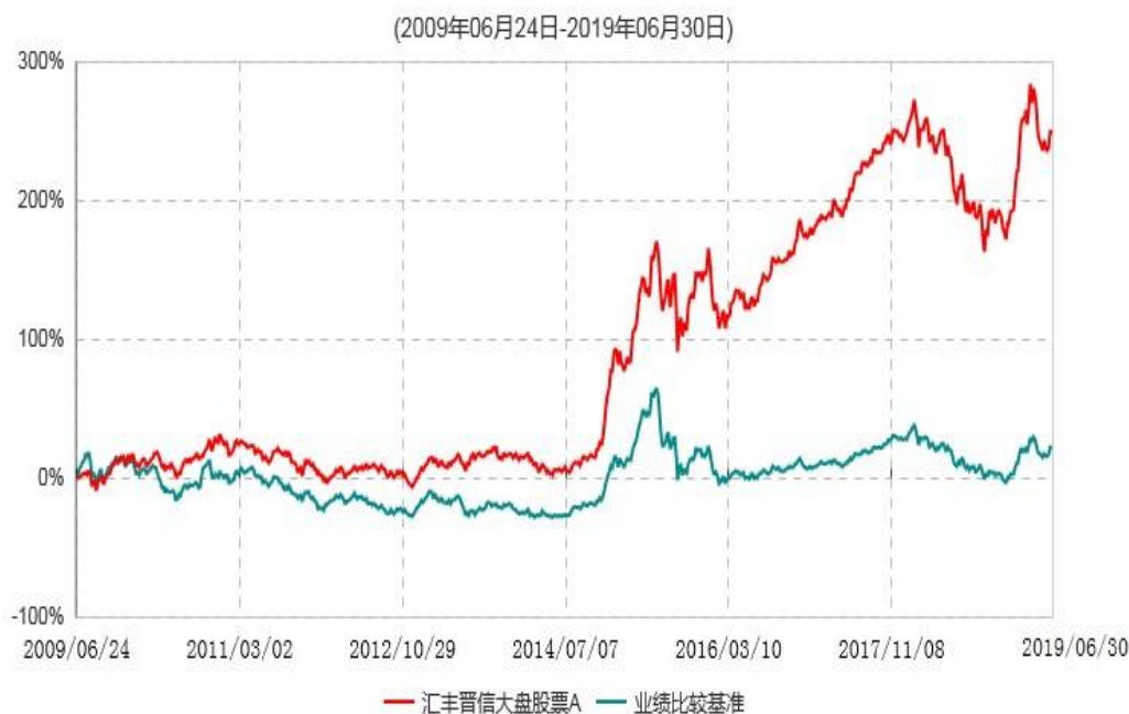
汇丰晋信大盘股票A累计净值增长率与业绩比较基准收益率历史走势对比图