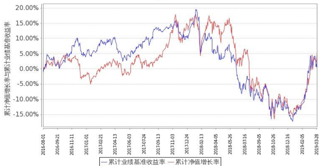
图 2：嘉实成长收益混合 H 基金份额累计净值增长率与同期业绩比较基准收益率的历史走势对比图