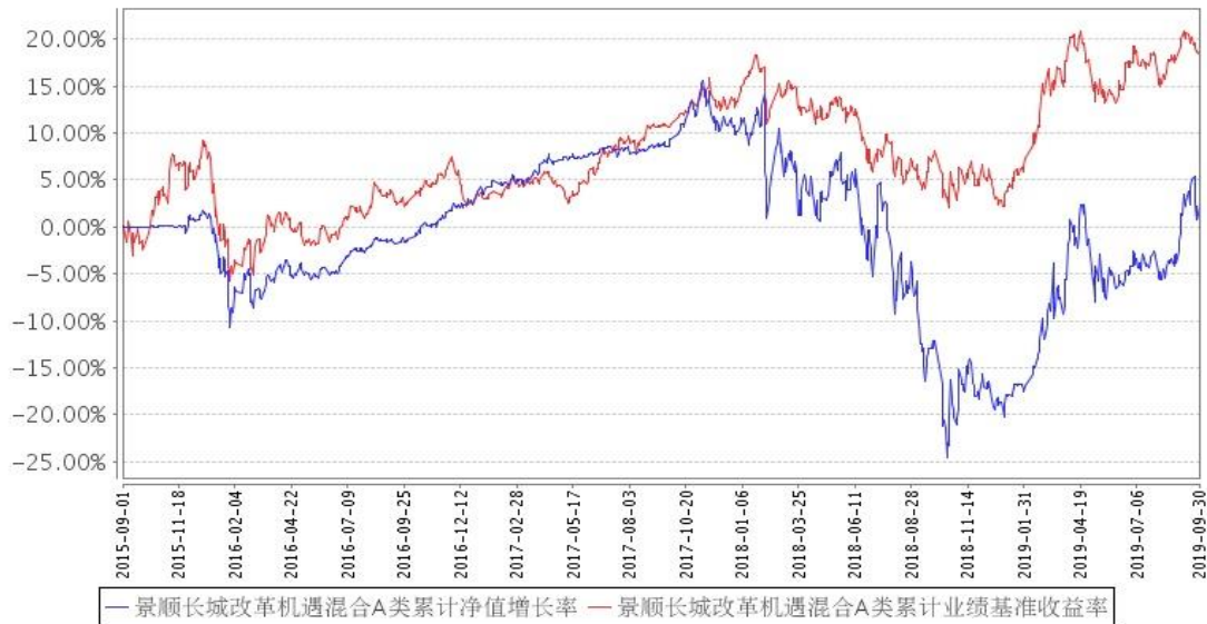
景顺长城改革机遇混合A类累计净值增长率与同期业绩比较基准收益率的历史走势对比图