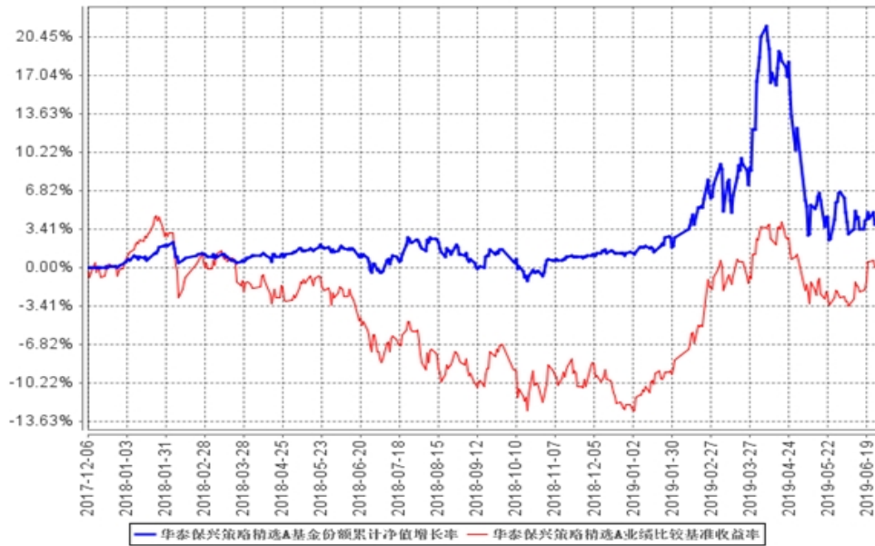
华泰保兴策略精选A基金份额累计净值增长率与同期业绩比较基准收益率的历史走势对比图

2、自基金合同生效以来基金份额累计净值增长率与业绩比较基准收益率历史走势对比（2017年12月6日至2019年6月30日）