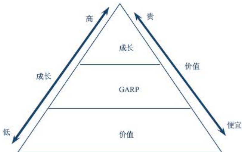
图 1 GARP 投资理念

② 对价值型公司的成长属性进行分析，可以发现相对投资价值较具成长性的股票，在成长潜力释放的过程中获得收益，规避市场价格未合理反映其成长性不足的股票。