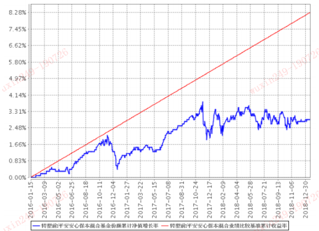
平安安心保本混合基金份额累计净值增长率与同期业绩比较基准收益率的历史走势对比图

注: 1、本基金基金合同于 2016 年 1 月 15 日正式生效, 截至报告期末已满三年;