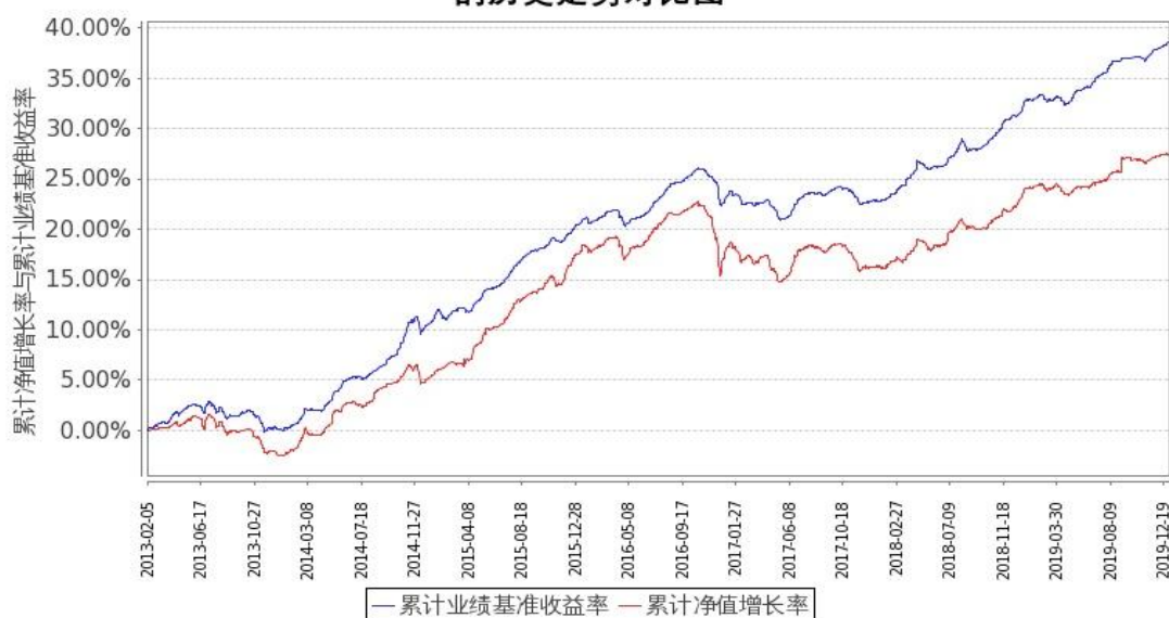
图2：嘉实中证中期企业债指数(LOF)C基金份额累计净值增长率与同期业绩比较基准收益率的历史走势对比图