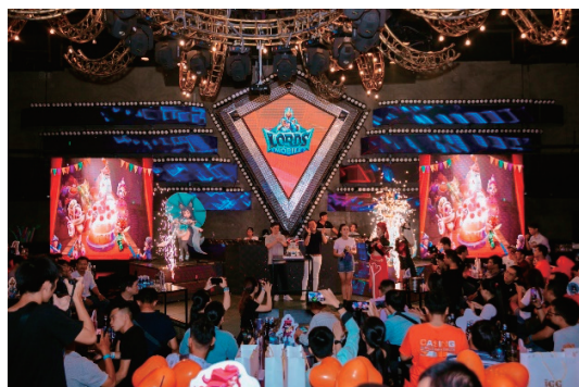
《王國紀元》線下見面會