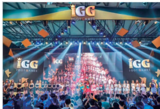
中國國際數碼互動娛樂展覽會(ChinaJoy)