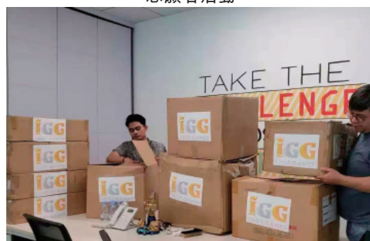
籌備醫療物資捐贈