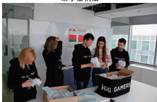
籌備醫療物資捐贈