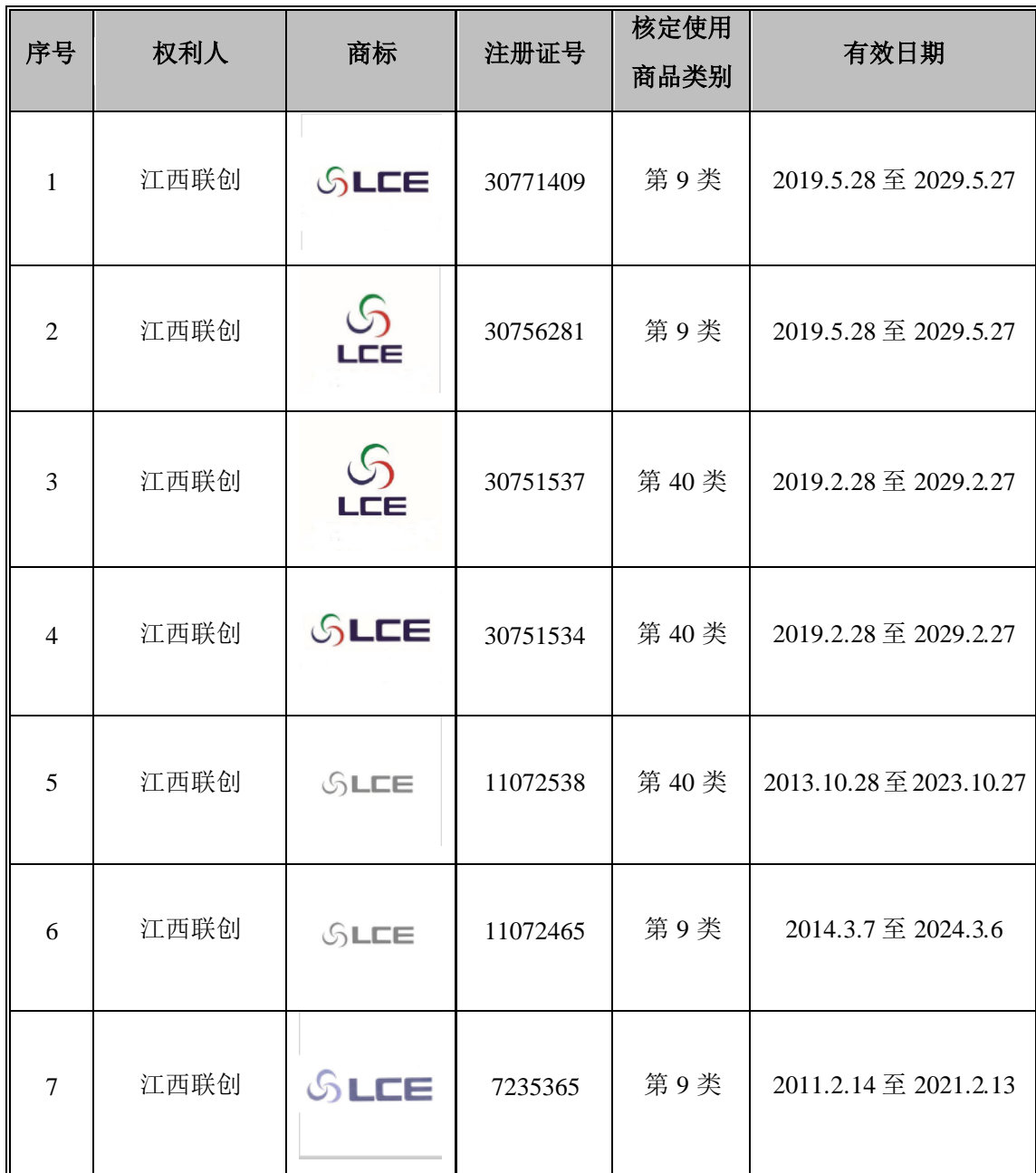
附表四：发行人及子公司享有的商标权