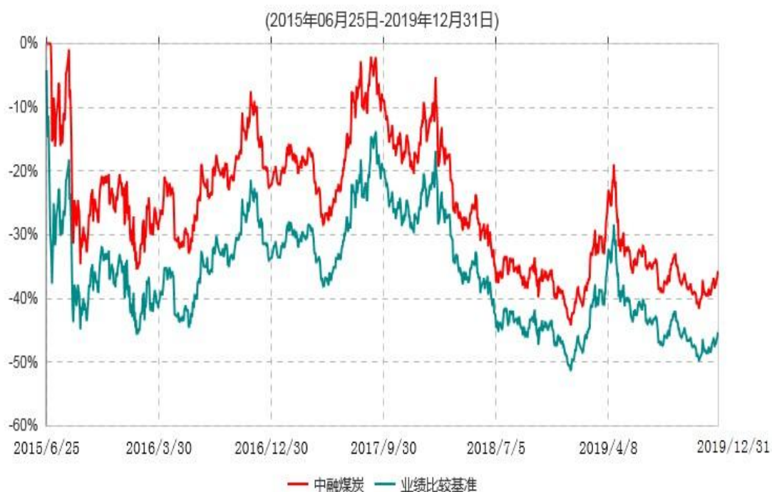
中融中证煤炭指数分级证券投资基金累计净值增长率与业绩比较基准收益率历史走势对比图

注：按基金合同和招募说明书的约定，本基金自基金合同生效日起6个月内为建仓期，建仓期结束时本基金的各项投资比例符合基金合同的有关约定。