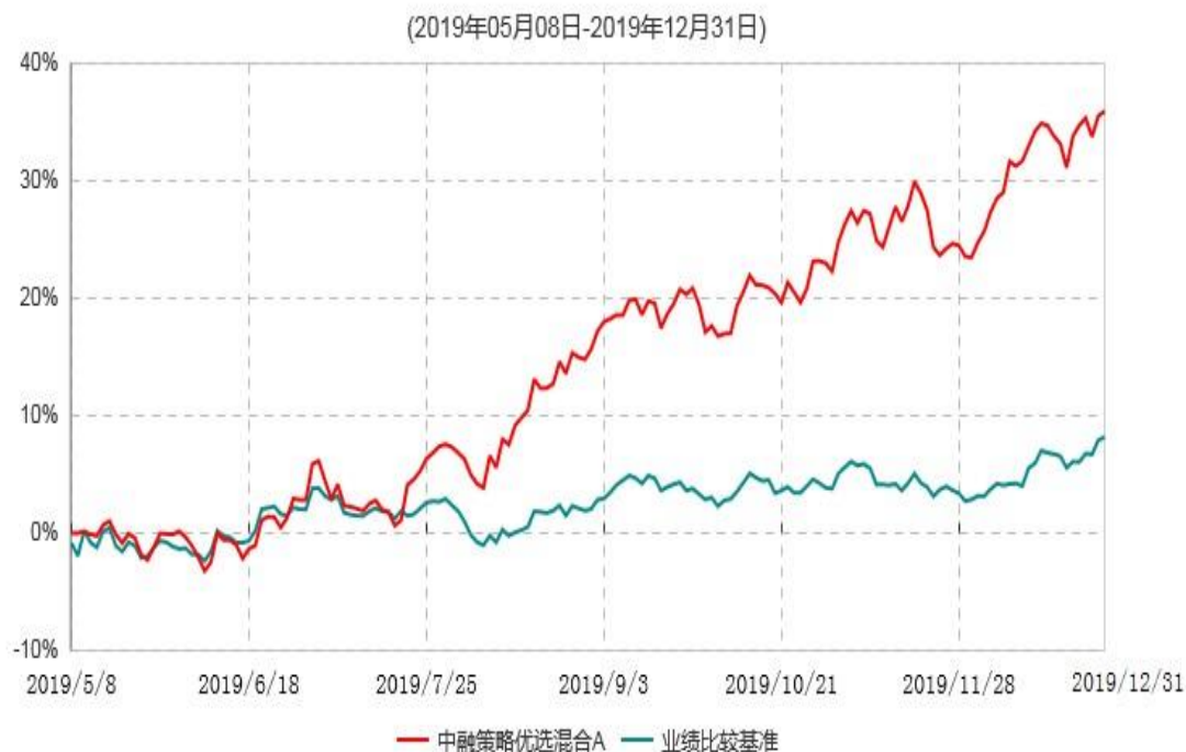
中融策略优选混合A累计净值增长率与业绩比较基准收益率历史走势对比图