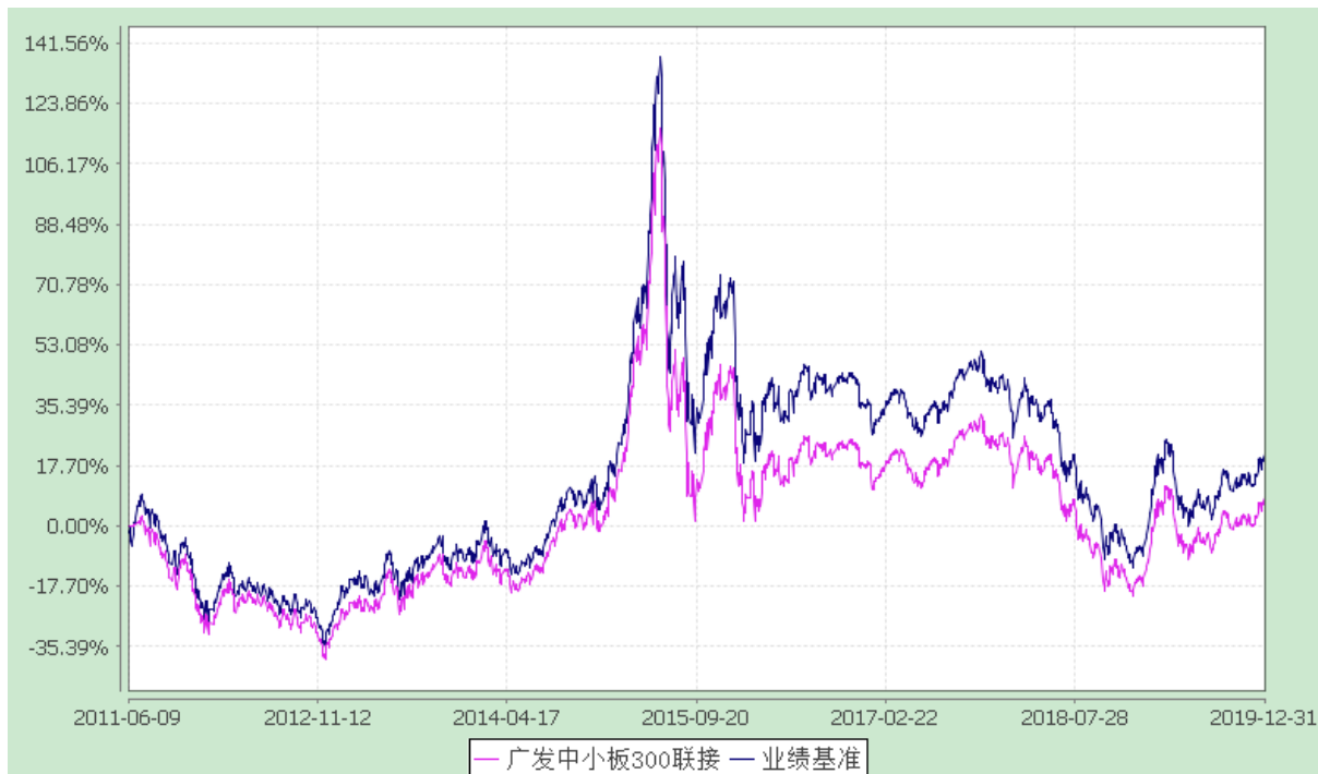
广发中小板 300 交易型开放式指数证券投资基金联接基金 份额累计净值增长率与业绩比较基准收益率的历史走势对比图 (2011 年 6 月 9 日至 2019 年 12 月 31 日)