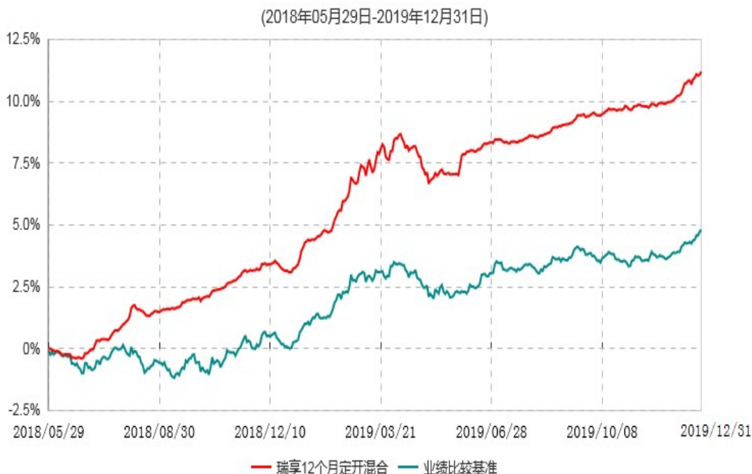
财通资管瑞享12个月定期开放混合型证券投资基金累计净值增长率与业绩比较基准收益率历史走势对比图

注：自基金合同生效至报告期末，财通资管瑞享12个月定期开放混合型证券投资基金份额净值增长率为11.26%，同期业绩比较基准收益率为4.83%。