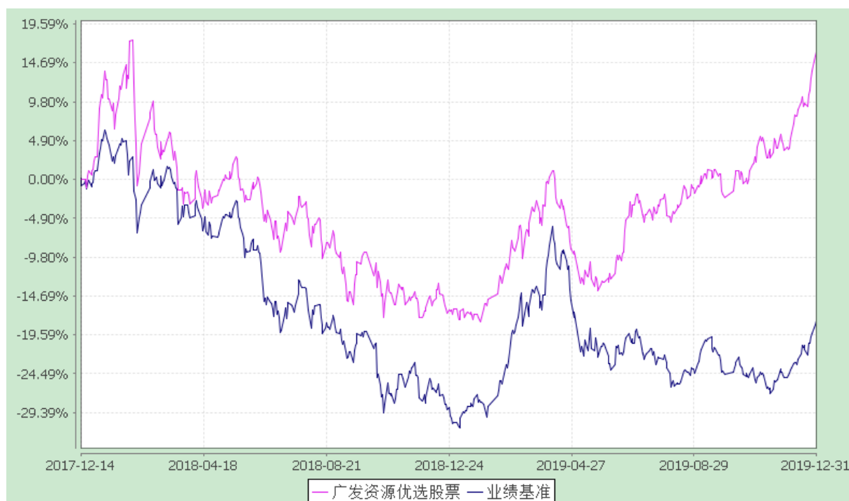
广发资源优选股票型发起式证券投资基金 份额累计净值增长率与业绩比较基准收益率的历史走势对比图 (2017 年 12 月 14 日至 2019 年 12 月 31 日)