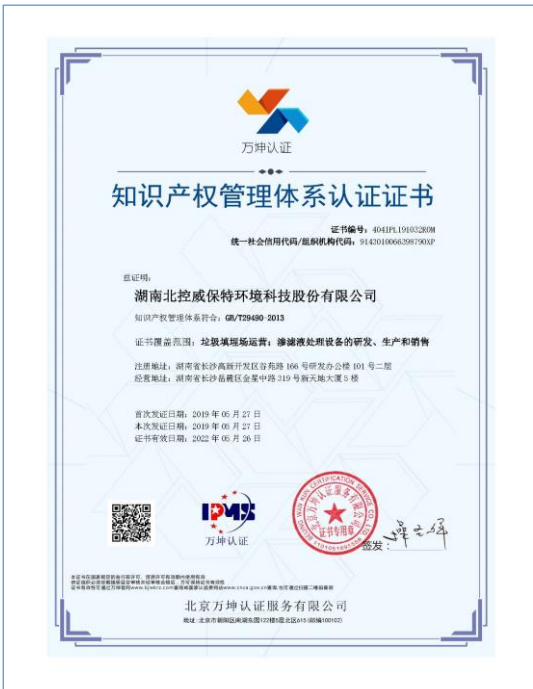
2019年5月,公司取得知识产权管理体系认证。