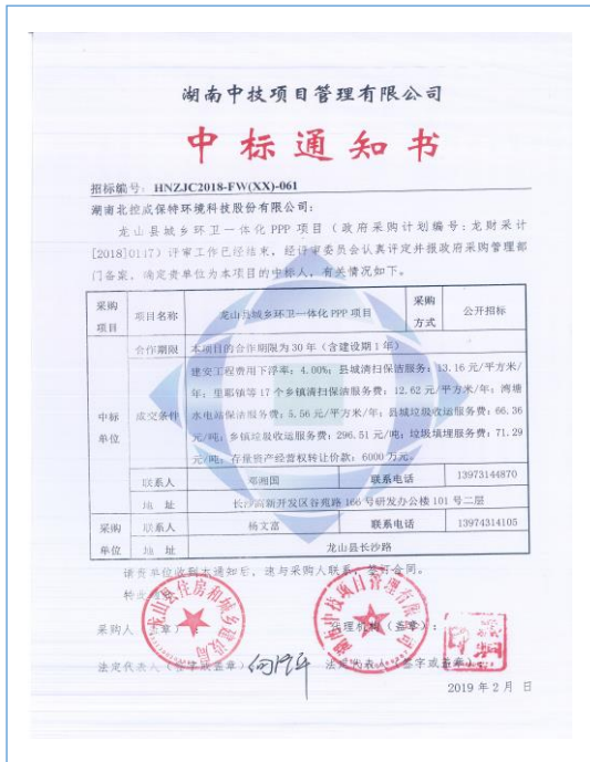
2019年2月,公司成功中标“龙山县城乡环卫一体化PPP项目”,合作期限为30年。