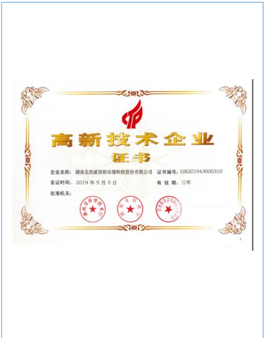
2019年9月,公司顺利通过高新技术企业复审。